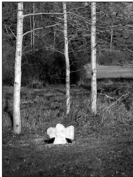
Smírčí kříž v obci Kacanovy 5. 7. 2012 (vlevo) a jeho nové osazení v Hubenově 15. 11. 2018.