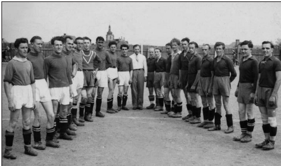
Kralovice – Sparta Kralovice a SK Mladotice před zápasem, 1940 (obrazová kronika A.C.Sparty v Kralovicích).

V roce 1939 se klub znovu zúčastnil fotbalového turnaje v Manětíně, kde hrál ještě SK Plasy, SK Kaznějov a SK Mrtník, které se spolu s Manětínem utkaly v jedné skupině, kterou vyhrál SK Plasy. Olympie Kozlany, SK Plasy II a SK Mladotice hrály druhou skupinu, v níž zvítězil mladotický tým. Ve finále pak brankou Sebránka v nastaveném čase porazil SK Plasy 1:0 a manětínský turnaj, stejně jako v roce 1935 vyhrál. 12) Po turnaji pak tým hostoval v Kozlanech, kde